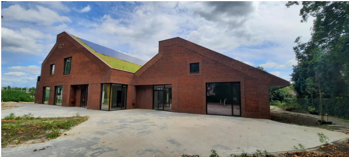
't Puzzels Tuk basisschool en dorps huis

We hebben met veel zorg en aandacht woningbouwprojecten gerealiseerd in 2022, zoals 6 woningen in 't Loo, 13 woningen in Heerde. Maar wat hebben we ook veel bestaande gebouwen en woningen voorzien van een nieuwe levensfase! Ook hebben we mooie utiliteitsgebouwen gerealiseerd, zoals een Kleinschalige woonvorm voor WZU in Nunspeet en het Hart van Oosterwolde in Oosterwolde.