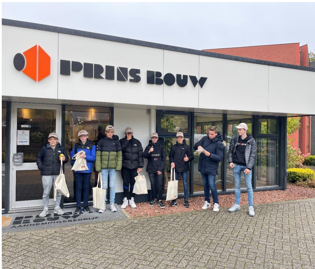
Leerlingen van klas 3 van het Nuborgh College op oriëntatie bezoek.

We blijven in gesprek met onze stakeholders en zullen jaarlijks de MVO speerpunten herzien. De doelstellingen uit het beleid van Prins Bouw voeren we stapsgewijs uit.