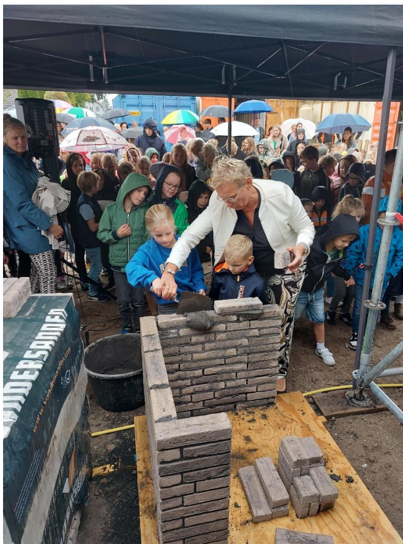
Eerste steen IKC De Regenboog Oldebroek

Prins Bouw legt zich toe op onderhoud, verbouw, renovatie en restauratie. En zoekt wegen om gebouwen en bouwwerken bruikbaar te maken en te houden. We zullen ons op het gebied van duurzaam bouwen en duurzame gebouwen blijven verbeteren.