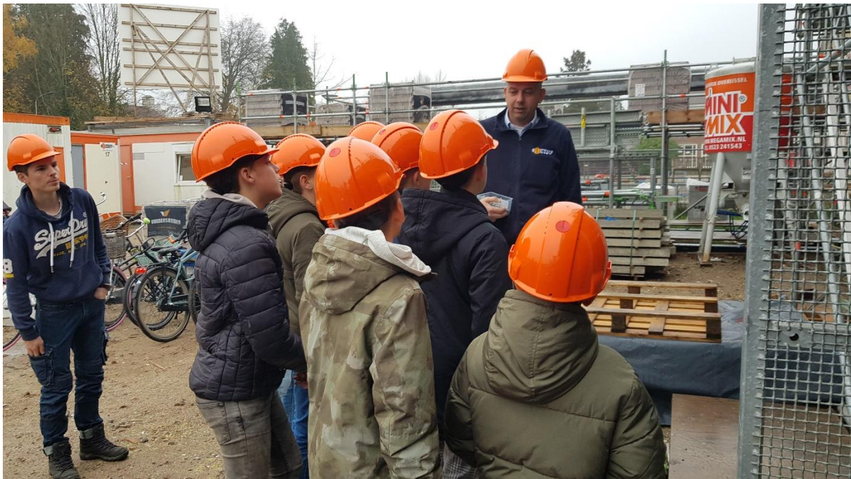
Techniekklas groep 7 en 8 basisscholen op de bouwplaats.

We blijven in gesprek met onze stakeholders en zullen jaarlijks de MVO- speerpunten herzien. De doelstellingen uit het beleid van Prins Bouw voeren we stapsgewijs uit.